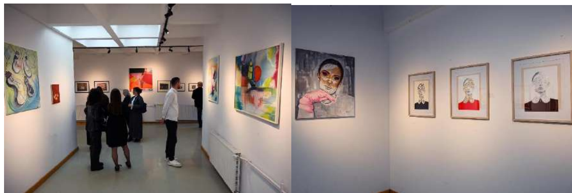
Foto nga ekspozita

Me 19 prill në Shtëpinë e Kulturës “Isa Kastrati” u organizua një ekspozitë kolektive e artistëve të Komunës së Kamenicës.